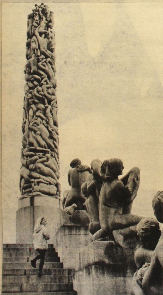
Oslo. Al «Vigland Park» una bimba osserva alcune delle monumentali statue raffiguranti «la storia della vita».