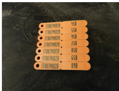
Fig. 2. Tip Tag auricolari