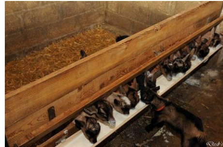
Fig. 2. Distribuzione del latte con canaletta