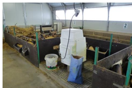
Fig. 4. Allattatrice automatica (Lupa)