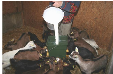
Fig. 3. Distribuzione del latte con multibiberon