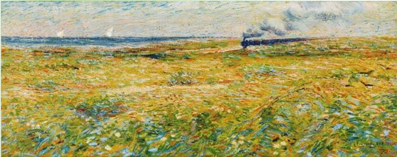
U. Boccioni, Il treno che passa , 1908

Lo sviluppo delle ferrovie ha un impatto sconvolgente nella vita degli individui. Il rumore, la velocità e l'impatto visivo di un «mostro» metallico spingono alla riflessione e al confronto con il silenzio e la lentezza dei ritmi naturali.