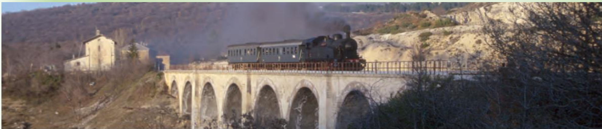
Linea Ferroviaria Sulmona-Castel di Sangro, «la transiberiana d'Italia»