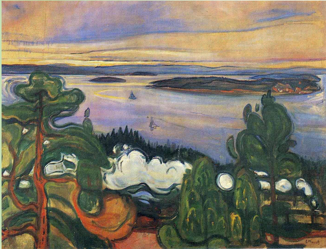
E. Munch, Il fumo della locomotiva, 1900

Il treno svolge anche un ruolo fondamentale come strumento per viaggiare e per sognare mondi lontani.