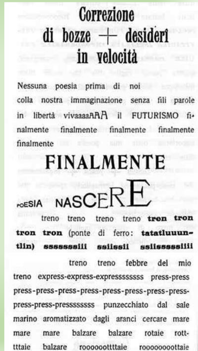
F.T. Marinetti 1913