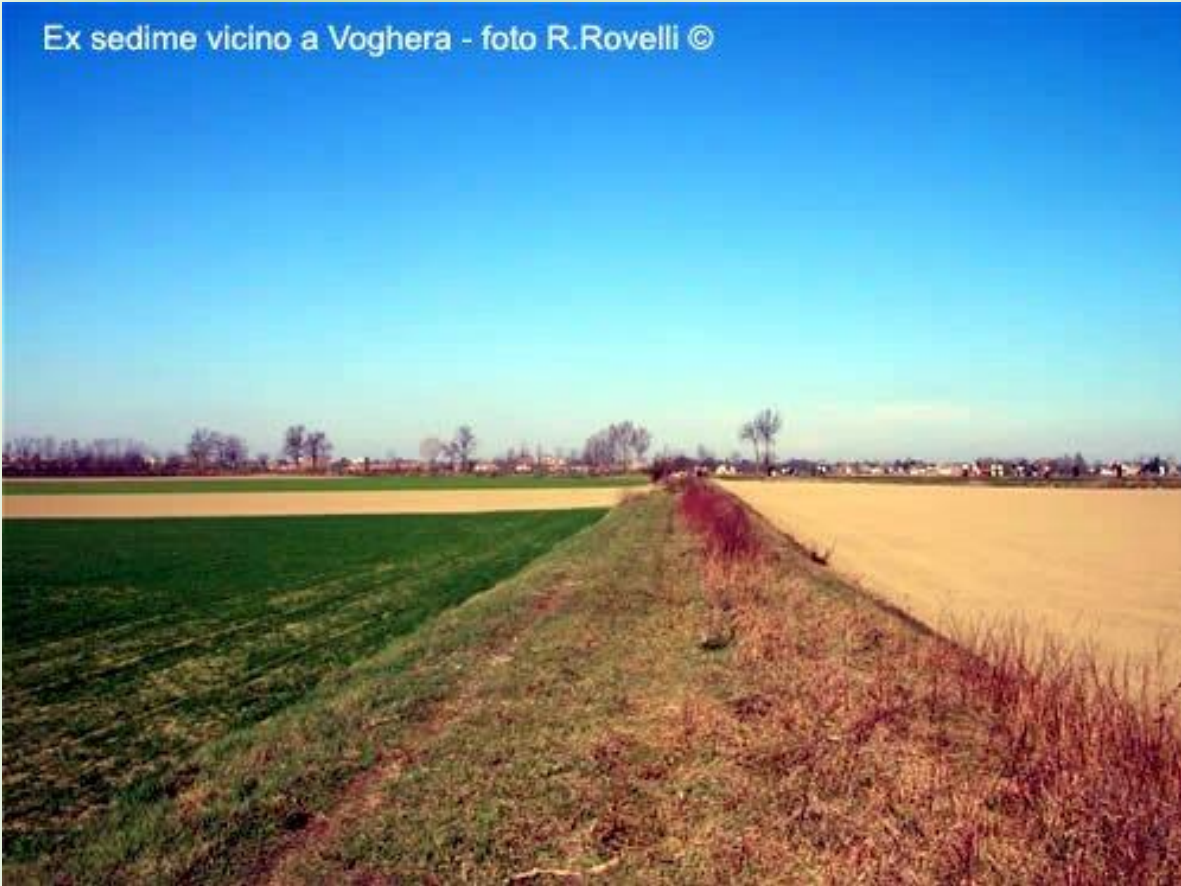
Ex sedime vicino a Voghera

Una pista ciclo-pedonale a disposizione dei residenti, utilizzata soprattutto per il fitness quotidiano, risulta invece debole la valorizzazione dal punto di vista turistico.