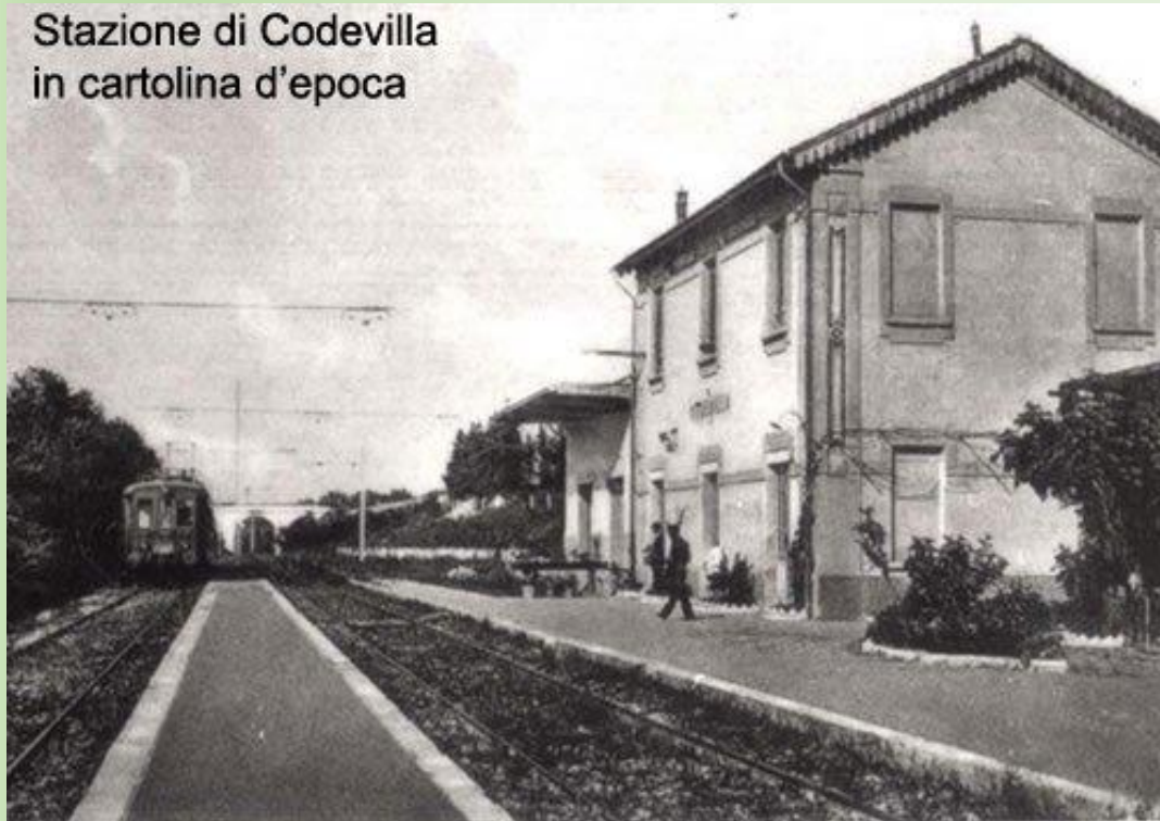
CODEVILLA - Stazione Ferroviaria (Ferr. Elettrica Voghera-Varzi)