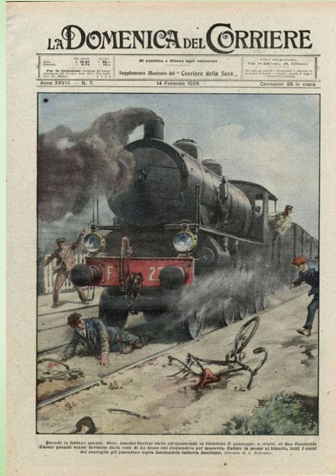
La Domenica del Corriere, 1923

Dal punto di vista storico, la ferrovia ha svolto per l'Italia un ruolo fondamentale nella costruzione di un territorio nazionale: - dal punto di vista pratico, con la realizzazione di una capillare rete di collegamento tra i centri abitati; - dal punto di vista narrativo, come simbolo del processo di unificazione nazionale.