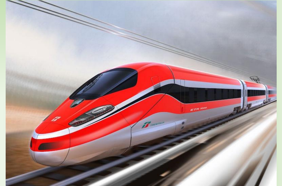
Frecciarossa ETR 1000 – Pietro Mennea