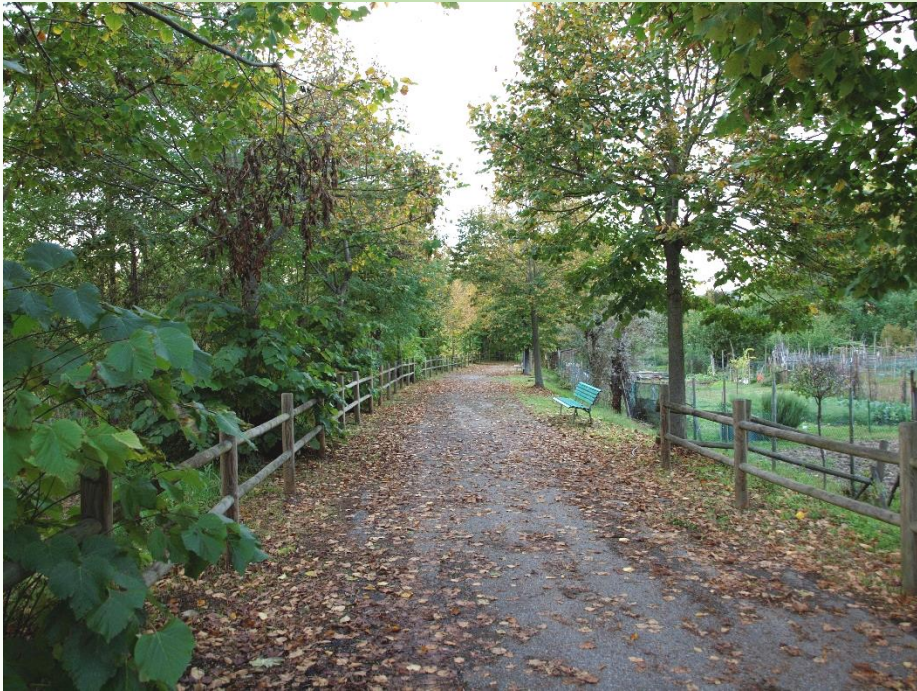
Percorso pedonale a Godiasco

Nel tratto Rivanazzano-Varzi, la massicciata risulta mantenuta solo nei brevi tratti interni ai paesi, per il resto è in gran parte inerbata